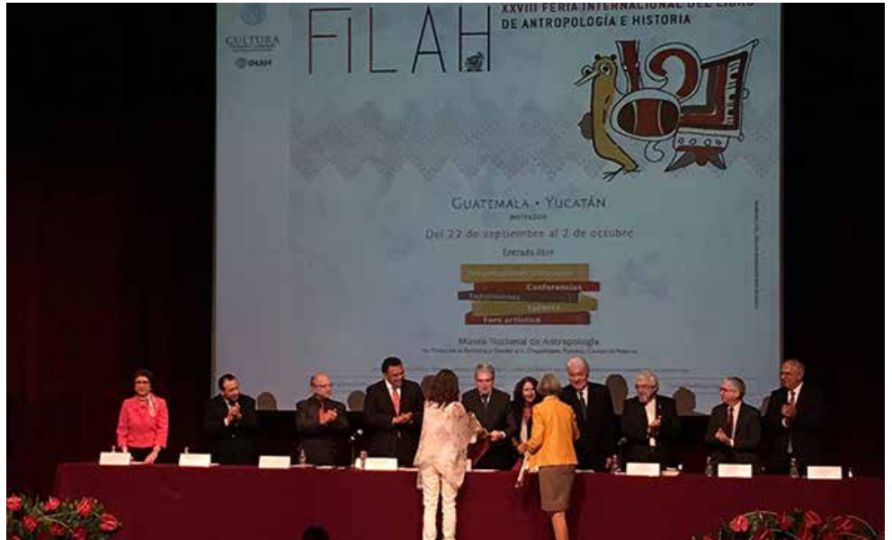
Ceremonia de entrega del Premio Antonio García Cubas.

* Con información de Notimex y Éricka Montaña / La Jornada