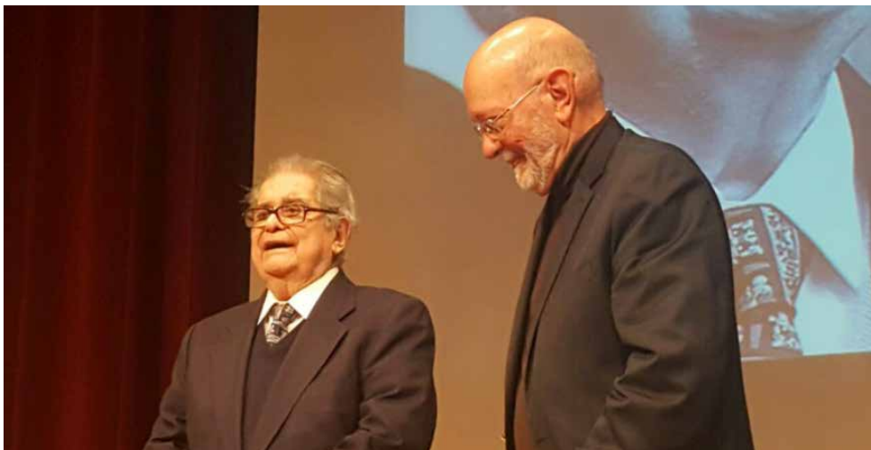
Una de las actividades principales tuvo lugar el viernes, el Homenaje al historiador Miguel León Portilla, quien cumpliera 90 años en febrero de este año. Miguel León Portilla y Eduardo Matos Moctezuma en el Homenaje al primero.